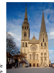
La façade occidentale

Depuis le IV e siècle où est mentionné le premier évêque Adventus, la cathédrale a été plusieurs fois reconstruite. Après l'incendie de 1020, l'évêque Fulbert, à l'enseignement influent, fait édifier la cathédrale romane, à laquelle on ajoute une nouvelle